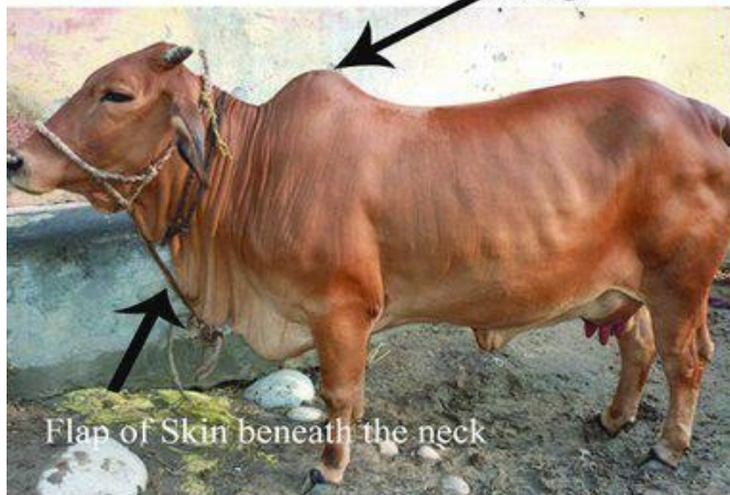
Holy Indian Cow

Evidence shows cow's milk is a link to solving medical mysteries, from diabetes to autism.